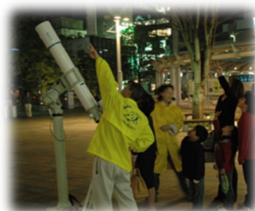
郡山駅前で星空観察(上) 望遠鏡づくりのワークショップ(震災被災地で)(下)