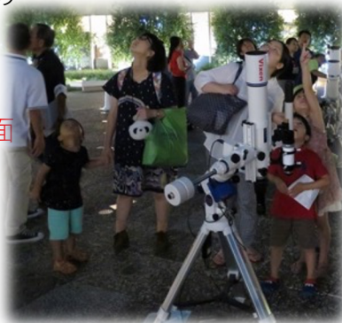
ショッピングセンターで星空観察会(上) 県立天文台での星空案内(下)