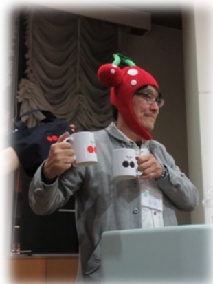
星空案内グッズの表彰式